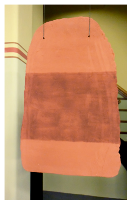
fragment 1 formaat 45 x 34 cm

De middelste vorm is geënt op de klokvorm maar vliegt er als het ware van weg en ook een associatie met de grote, gevoelige oren van de olifant is niet verwonderlijk. De losse roze vorm van de klei en het strakke rode vlak lijken niet bij elkaar te passen. De vormen links en rechts hangen er afzonderlijk naast. In religie heeft elke kleur een functie, in deze compositie spelen de rechthoekig vormen van de kleurvlakken een bindende rol.